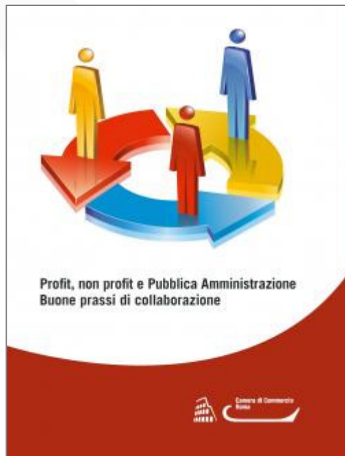
Buone prassi di collaborazione