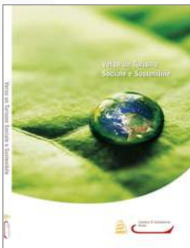
Turismo sociale e sostenibile