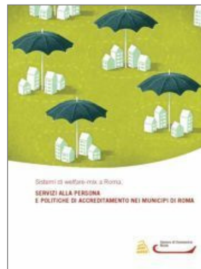
Servizi alla persona e politiche di accreditamento